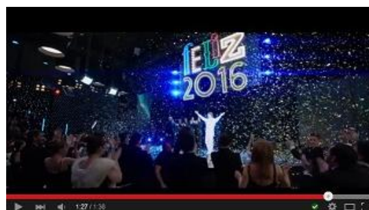
MI GRAN NOCHE , de Alex de la Iglesia José Frade Producciones Cinematográficas